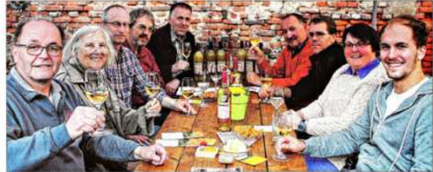
Beim gemütlichen Umtrunk wird die Auszeichnung gefeiert.

Erfreut waren die Anwesenden auch darüber, dass dieses Vermarktungsprojekt zur Unterstützung der Streuobstwiesen keine