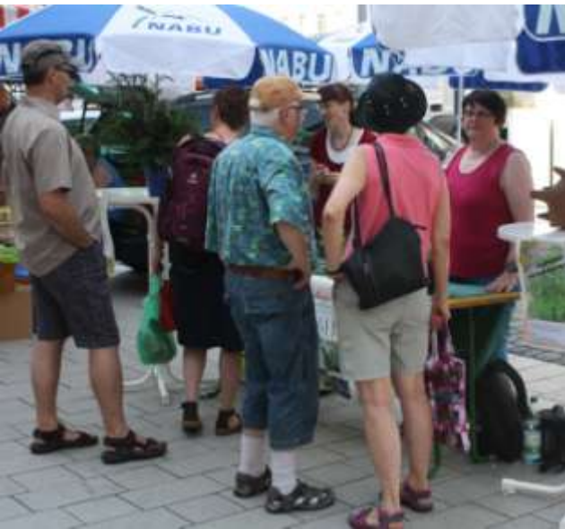
Stand auf der Kaiserstraße im Juli zum Thema Neophyten