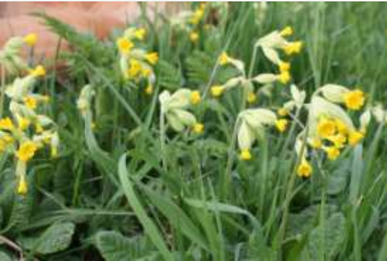
Schlüsselblumen am Wingert und in Ossenheim