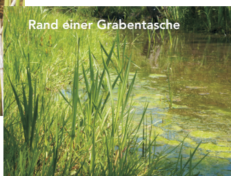
Rand einer Grabentasche

Die Unterwasserzone ist Laichplatz und Larvenhabitat verschiedener Libellen-, Fisch- und Amphibienarten.