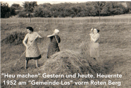
"Heu machen" Gestern und heute, Heuernte 1952 am "Gemeinde-Los" vorm Roten Berg

Nach der Renaturierung liegt nun ein Schwerpunkt der Schutzgebietspflege auf den feuchtgebundenen Lebensräumen.